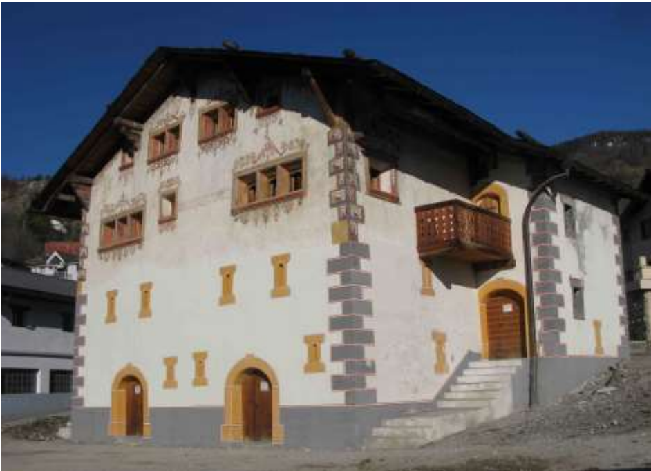
Das Walliser Suonenmuseum befindet sich in Botyre/Ayent.