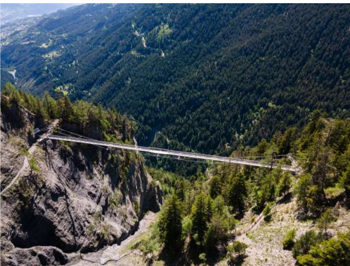
Die «Bisse du Ro» bei Crans-Montana ist spektakulär und atemberaubend zugleich.