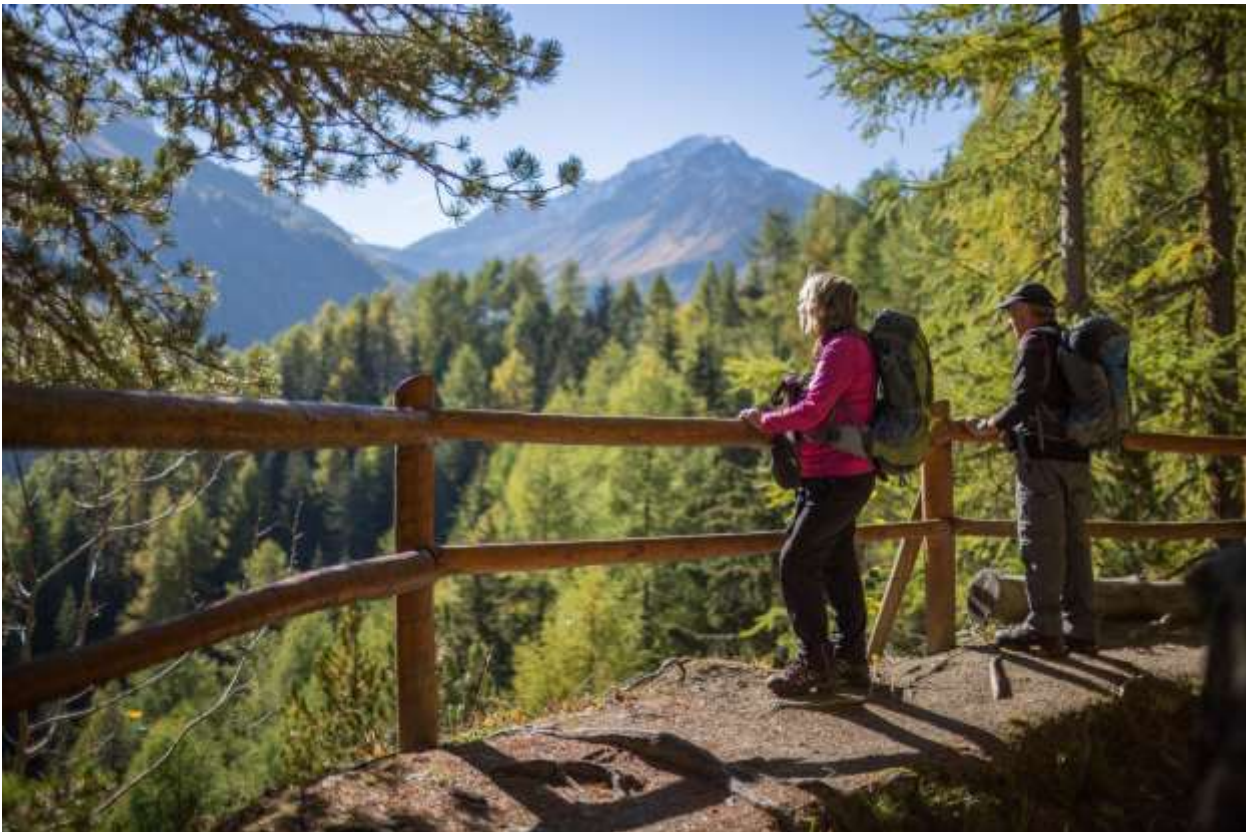
Die Bisse de Saxon ist die längste Suone im Wallis.